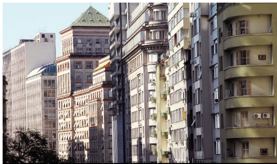
Uma das regiões afetadas pelo projeto seria a da avenida Borges de Medeiros, no Centro