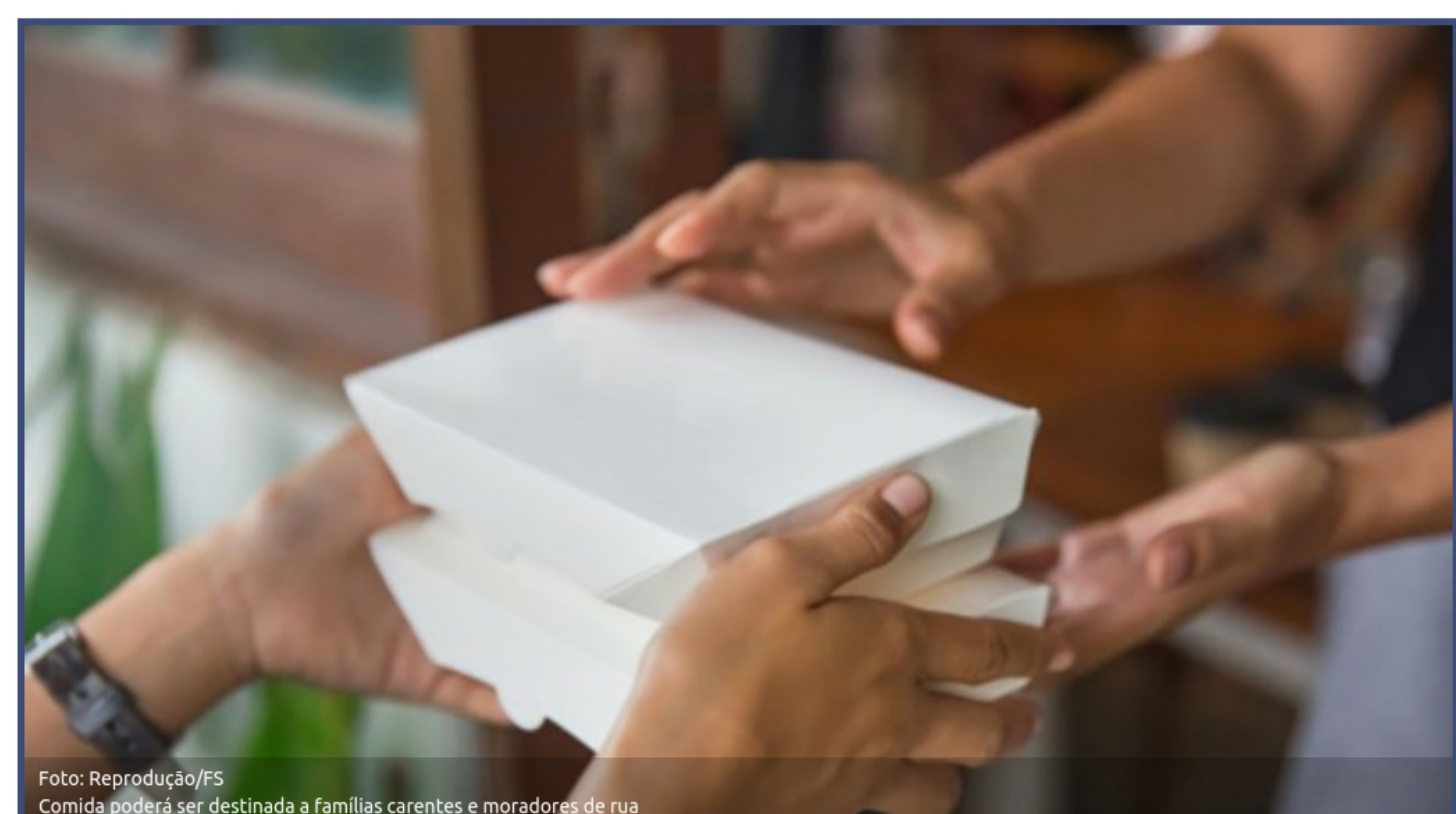
Comida poderá ser destinada a famílias carentes e moradores de rua

A doação de alimentos que sobram das cozinhas de restaurantes e outros serviços de alimentação agora é lei. Com isso, os estabelecimentos poderão doar a entidades as sobras de comida para destinar a pessoas carentes.