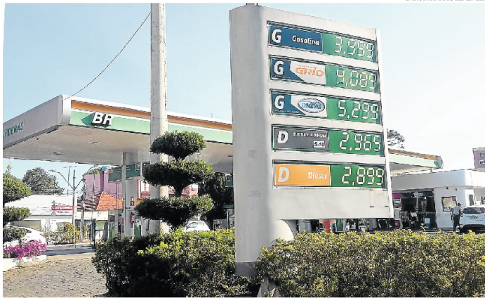
NOVO HAMBURGO: Justiça decidiu, mas preços continuavam semelhantes aos de terça-feira